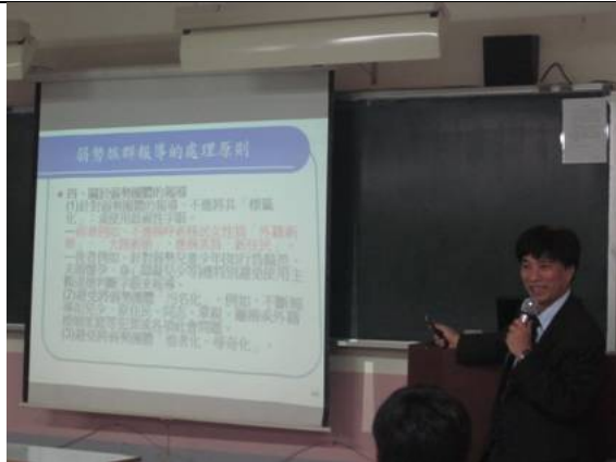
蘇分社長演講實景