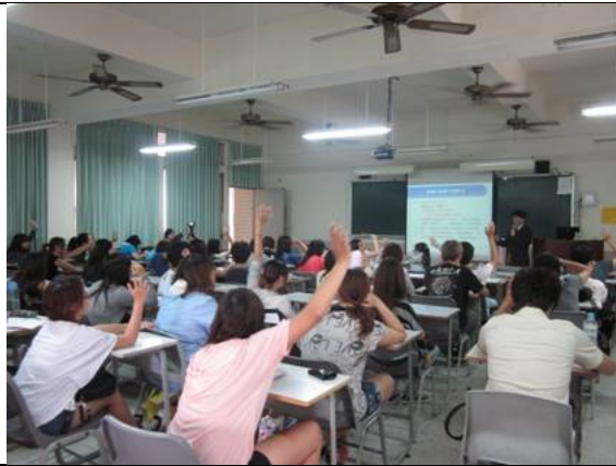
蘇分社長和學生課堂互動實況