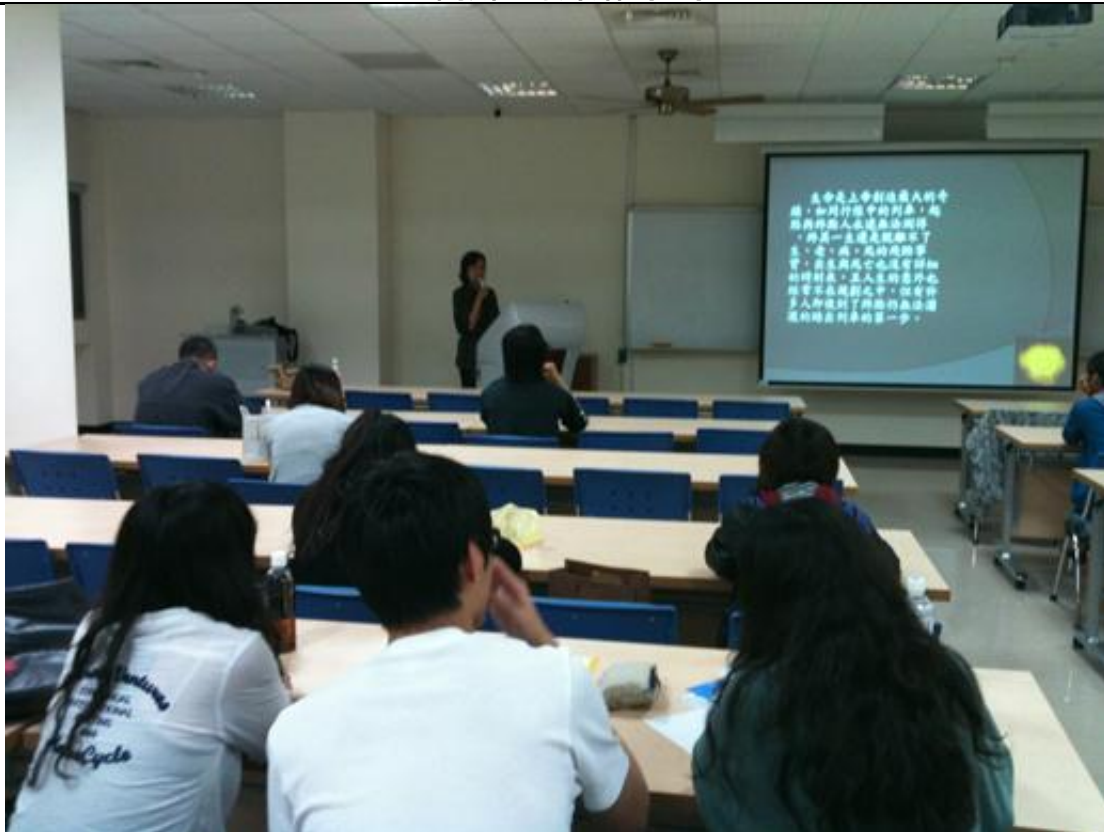
生命教育的介紹 (二)