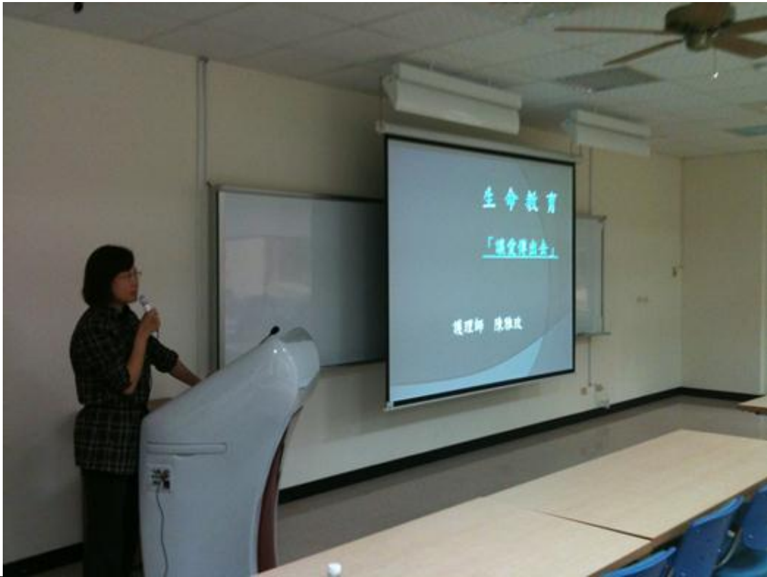
生命教育的介紹 (一)