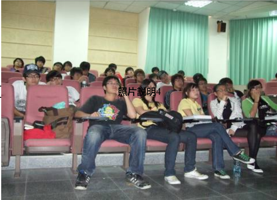
學生認真聽著演講內容，讓主講人感受到每位學生的認真。