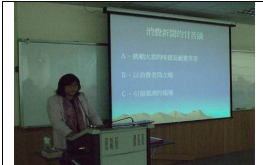
主講人將介紹今天所要演講的主題。