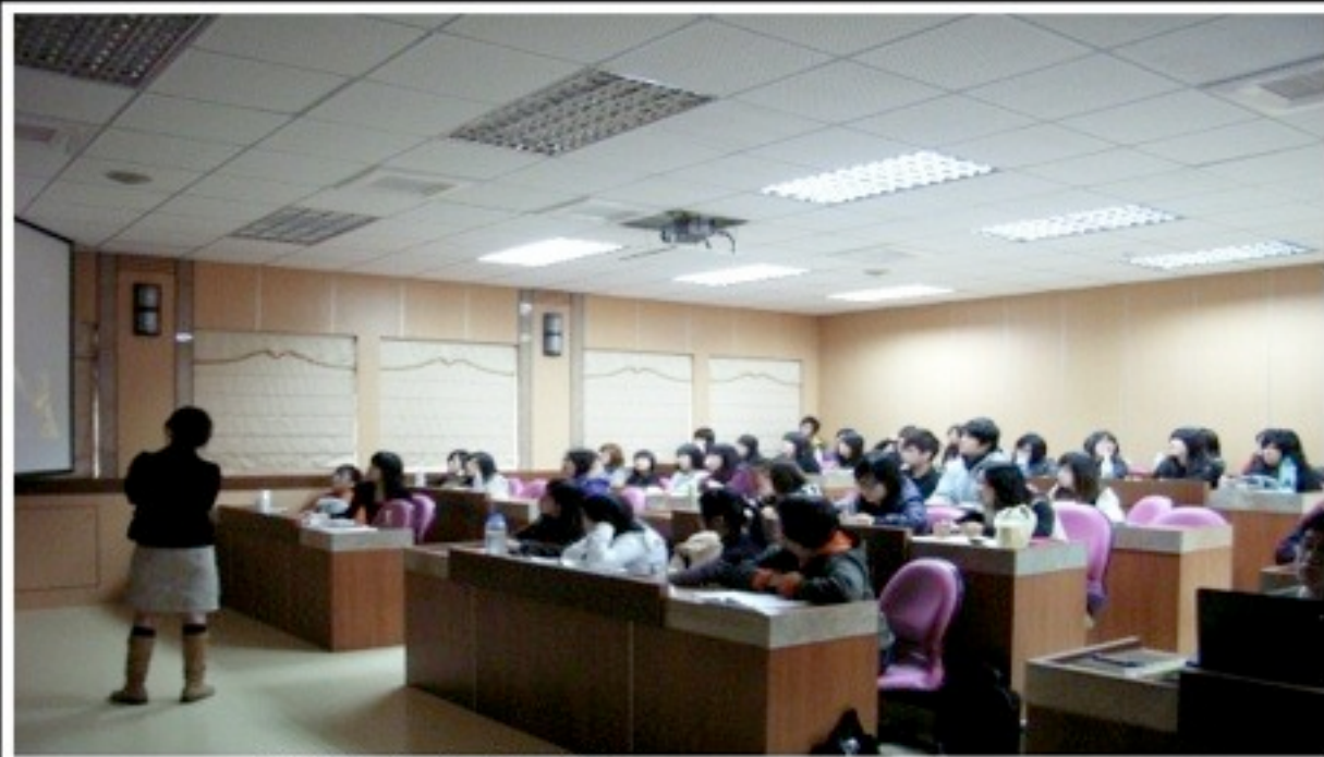
旅遊文案的發想- 課程進行實況